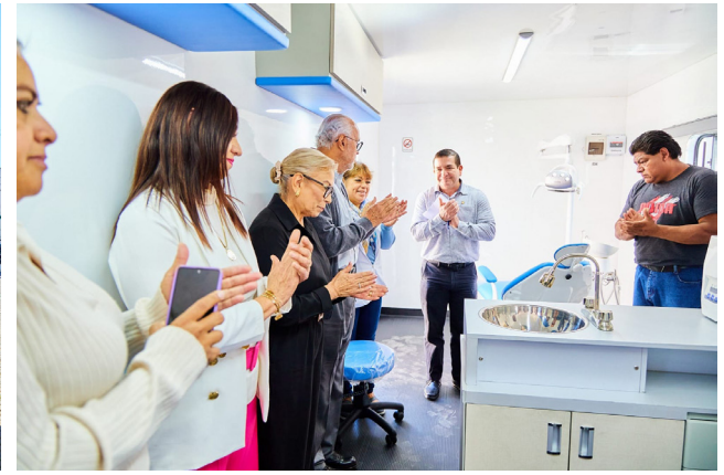
Gobierno del Estado y DIF Nayarit